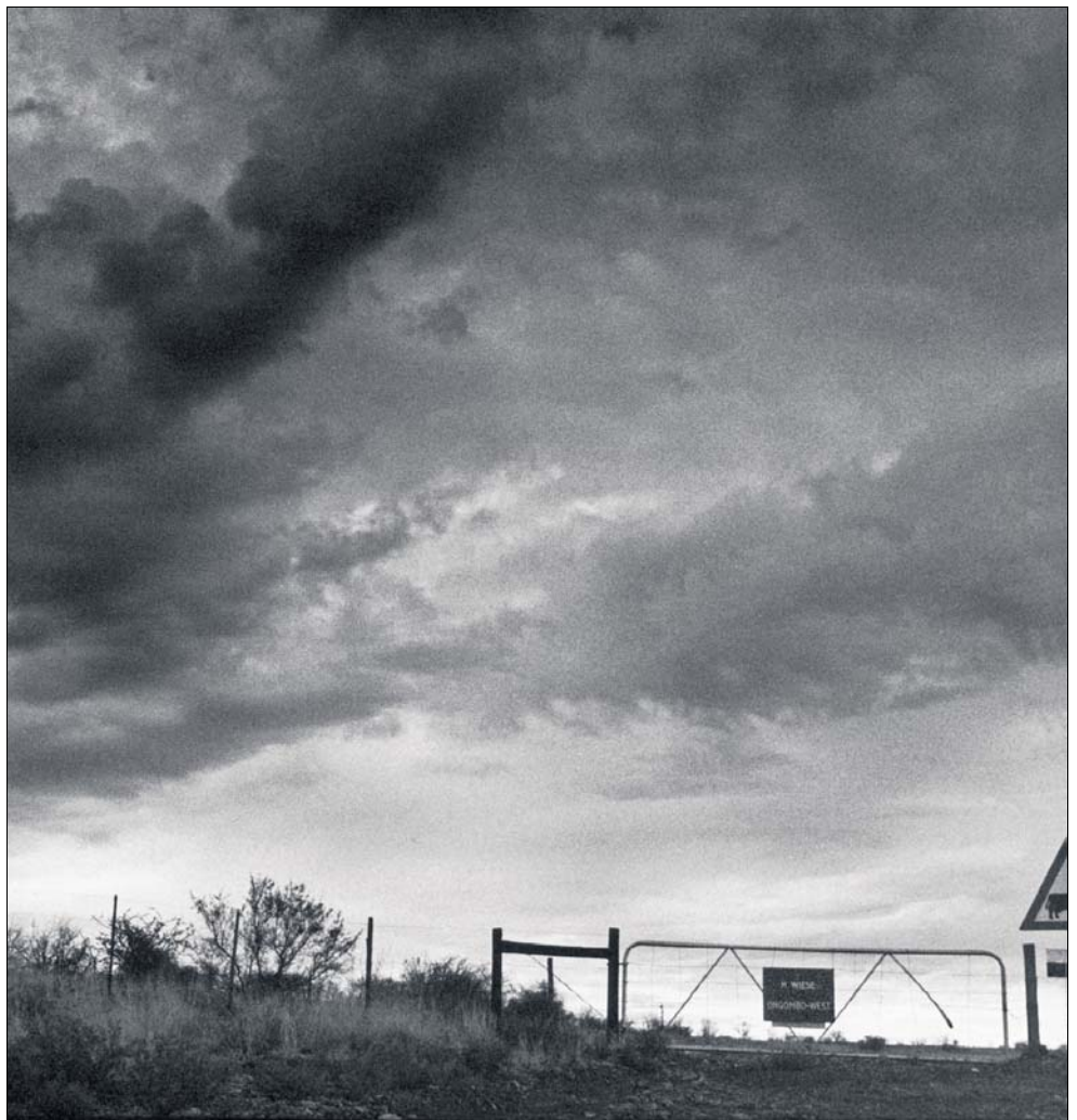
Die 4007 Hektaren werden unter besitzlosen Schwarzen aufgeteilt. Ob sie das Land auch bewirtschaften können, ist ungewiss.