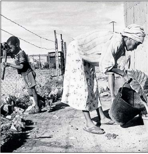
Siebzig Menschen ernährte die Farm, schwarze und weisse.