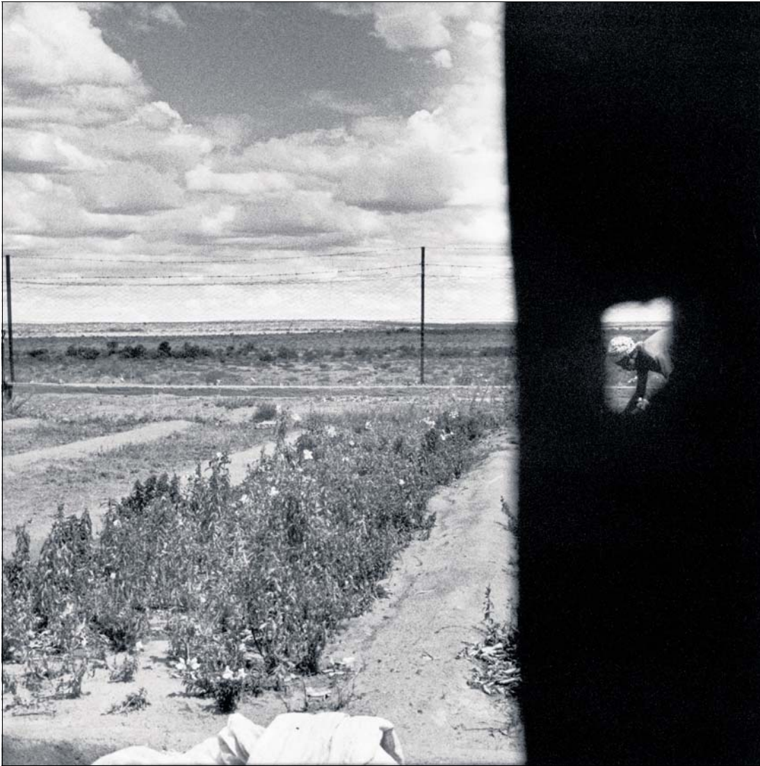
Namibia will mit dem Erbe des Kolonialismus aufräumen, die Landreform kommt nur langsam voran; jetzt hat die Regierung erstmals eine Farm enteignet.