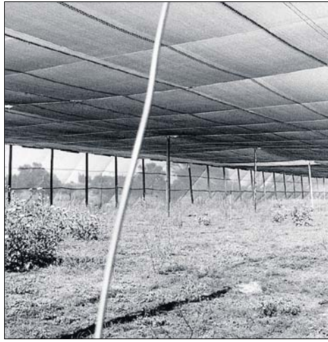
Das Kapital der Farm, die Anbauhalle für Calla, liegt nun brach.